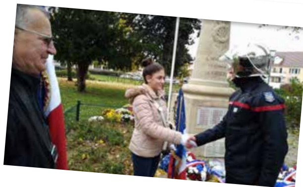
11/11 MONUMENT AUX MORTS Commémoration de l'armistice

À l'invitation du maire de la ville de Schio, la section Arac de Grigny s'est rendue dans la commune italienne afin de participer à la cérémonie de l'armistice de la première guerre mondiale qui a été signée en Italie le 4 novembre 1918.