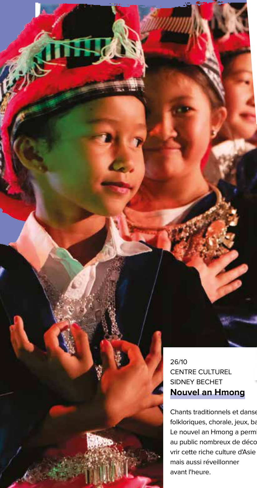
26/10 CENTRE CULTUREL SIDNEY BECHET Nouvel an Hmong

Chants traditionnels et danses folkloriques, chorale, jeux, bal... Le nouvel an Hmong a permis au public nombreux de découvrir cette riche culture d'Asie mais aussi réveiller avant l'heure.