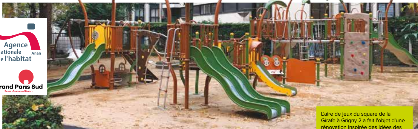
L'aire de jeux du square de la Girafe à Grigny 2 a fait l'objet d'une rénovation inspirée des idées des habitants.