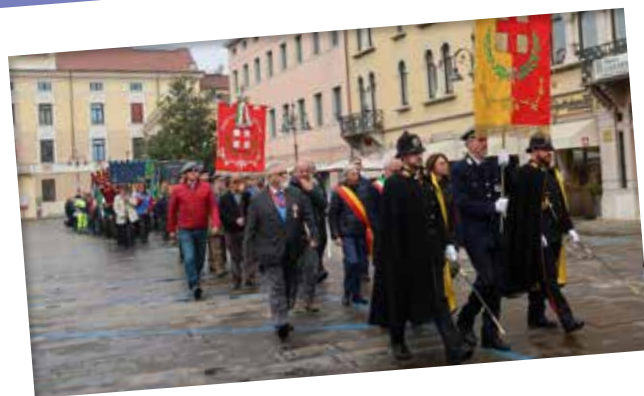
04/11 SCHIO (ITALIE) Hommage grignois aux morts italiens

Chants traditionnels et danses folkloriques, chorale, jeux, bal... Le nouvel an Hmong a permis au public nombreux de découvrir cette riche culture d'Asie mais aussi réveiller avant l'heure.