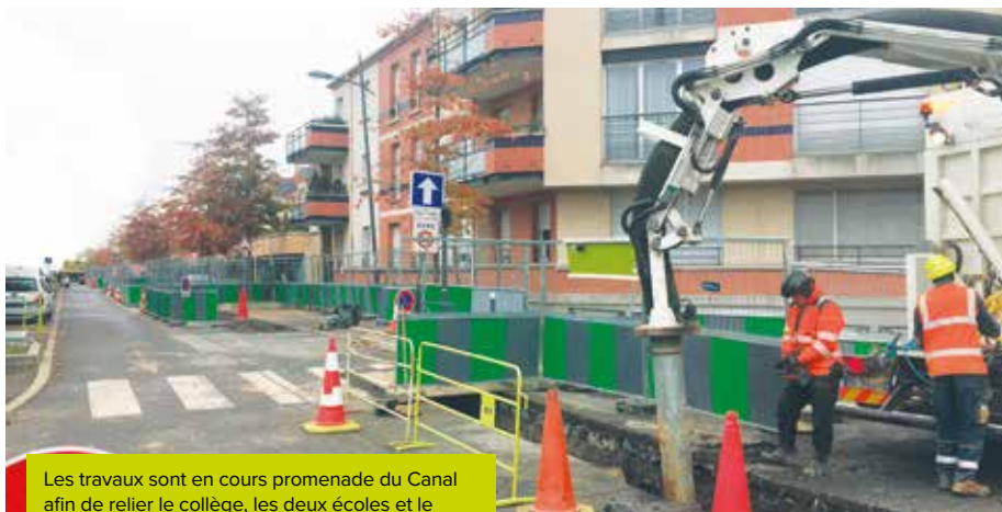
Les travaux sont en cours promenade du Canal afin de relier le collège, les deux écoles et le gymnase du quartier.

et Dulcie September, le gymnase de la Zac Centre-Ville, la Ferme Neuve et Cuisine Mode d'Emploi(s) bénéficieront de cette chaleur puisée dans le sol. 5000 logements de Grigny 2, 175 logements de la Zac Centre-Ville et plusieurs équipements publics sont aujourd'hui chauffés par la géothermie. À la Grande Borne, d'avril à octobre, l'eau chaude sanitaire dans l'ensemble des logements (mais aussi dans les écoles et au Centre de la vie sociale) est issue de la géothermie. ●